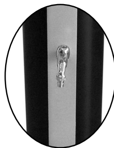
kohout na omývání nohou