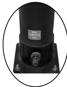
vypouštěcí a napouštěcí zátka