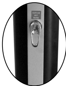
směšovací páková baterie