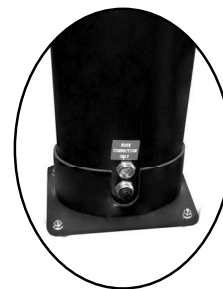
vypouštěcí a napouštěcí zátka