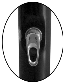
směšovací páková baterie